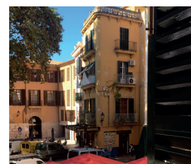
Geschäftswohnung in Palma