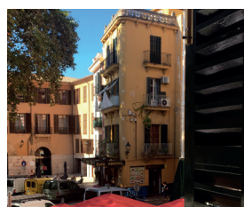
Geschäftswohnung in Palma