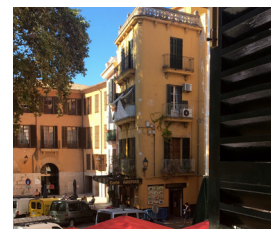
Geschäftswohnung in Palma